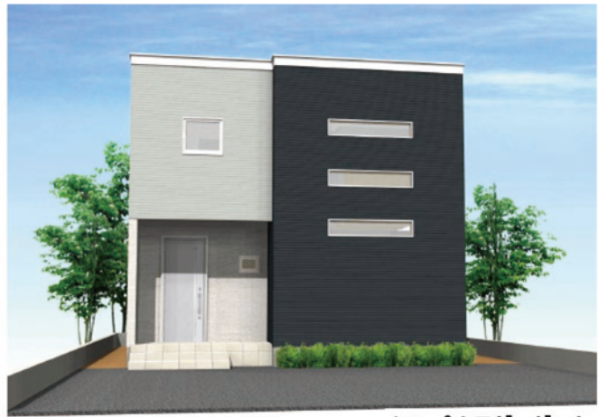
シンプルモダンダーク