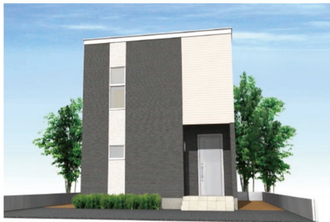
シンプルモダンダーク