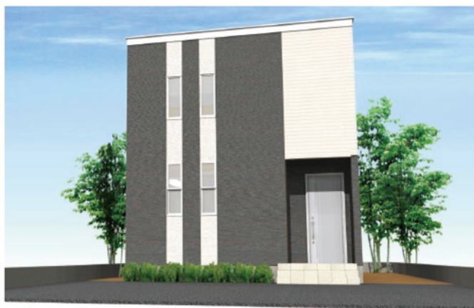
シンプルモダンダーク