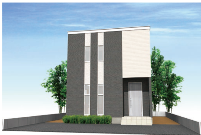
シンプルモダンダーク