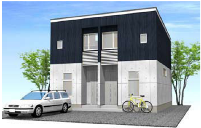
シンプルモダンダーク